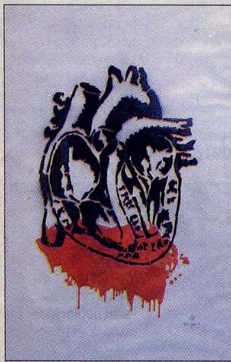
Mistral y Ocampo. La muestra se inspiró en su correspondencia.